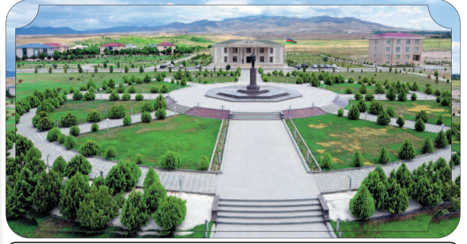
Kəngərli rayonunun Qıvraq qəsəbəsi