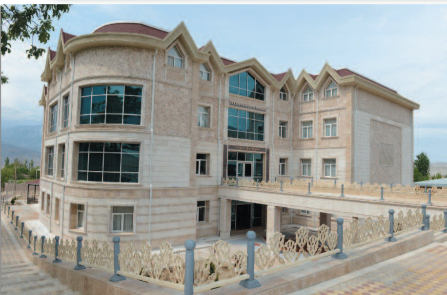
Ordubad şəhərində uşaq bağçası