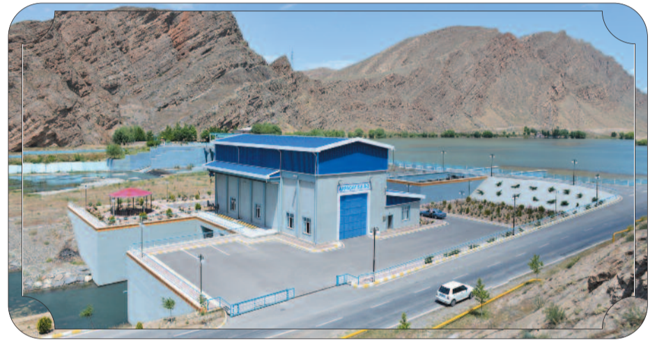
Arpaçay Su Elektrik Stansiyası