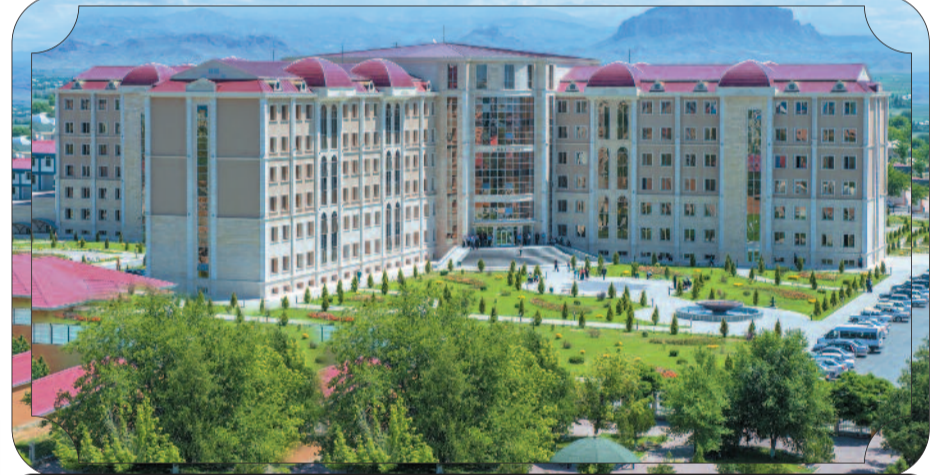
Naxçıvan Muxtar Respublika Xəstəxanası