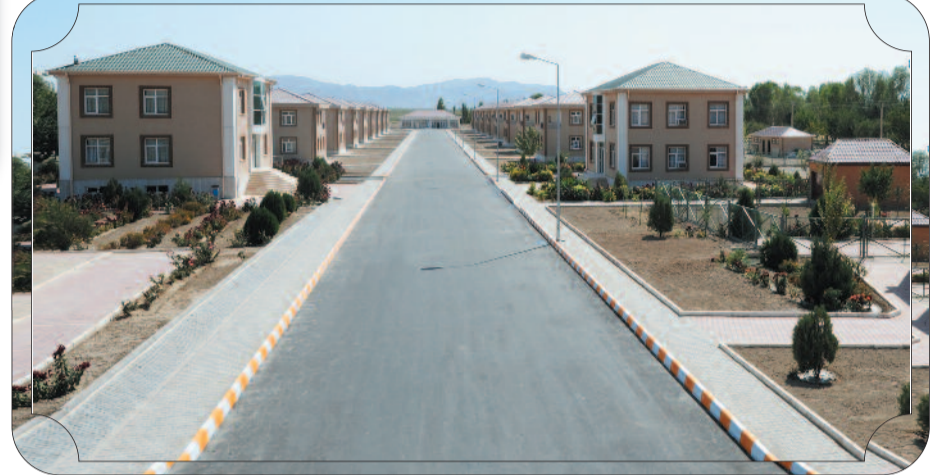
Sadərək rayonunun Heydərabad qəsəbəsi