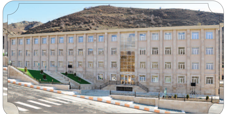
Şahbuz rayon Bığənək kənd tam orta məktəbi