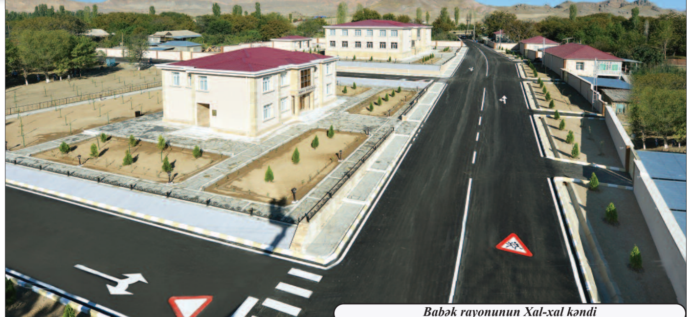
Babək rayonunun Xal-xal kəndi