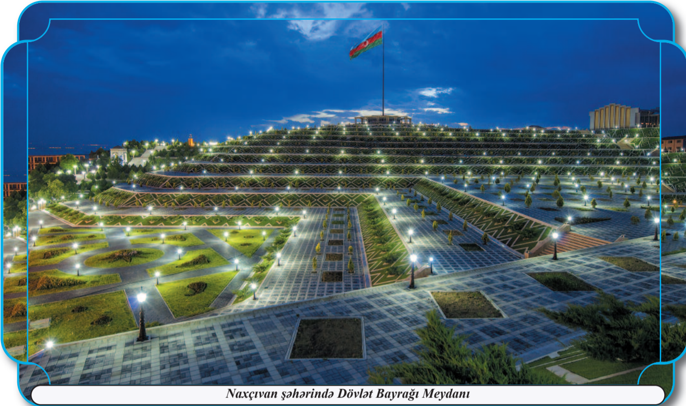
Naxçıvan şəhərində Dövlət Bayrağı Meydanı

T arixin bütün dövrlərində xalqlar üçün ən müqəddəs dəyərlərdən biri də azadlıq, müstəqillik olub. Azərbaycan xalqı da öz azadlığı, müstəqilliyi uğrunda əsrlərə mübarizə aparıb.